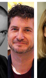
Tirsdag kl. 9.15