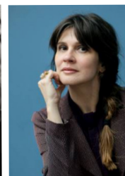
Onsdag kl. 10.15