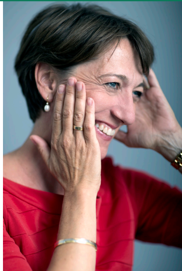
Tirsdag kl. 11.00