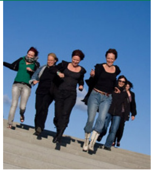
Tirsdag kl. 22.00

Et på mange måder uforglemmeligt år har bragt os ind i det nye årti. Her blæser forandringens vinde og såvel tradition og fornyelse hvirvles op. Hvad er løgn? Hvad er sandhed? Hvem er offer og hvem er gerningsmand? Hvem er vi – og er præsten et rigtigt menneske?