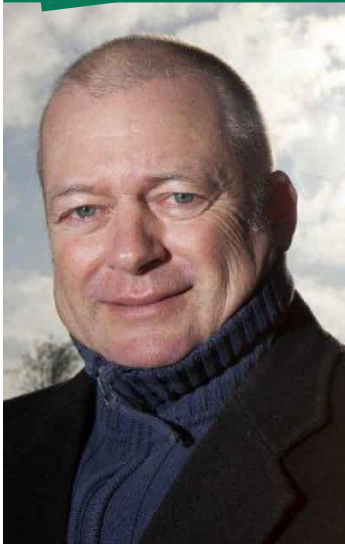
Mandag kl. 15.15

TILMELDING INDEN 1. JUNI 2021 TIL MOES@KM.DK