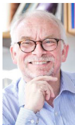
Mandag kl. 15.00