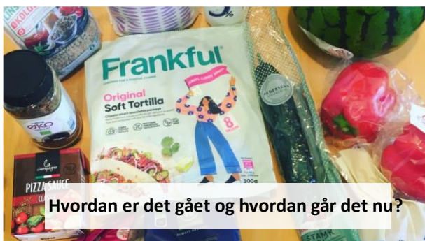
Hvordan er det gået og hvordan går det nu?

I begyndelsen fik vi rigtig mange henvendelser fra folk, som gerne ville modtage mad, og vi kunne ikke give til alle. Nu har vi nået en kapacitet, hvor vi kan give til alle ansøgere – som regel i løbet af samme måned. Vi har indført, at man skal søge fra gang til gang, så man altså ikke fast modtager mad fra kirken. Nogle søger og får hver måned, mens andre kun har behov og søger sjældnere.